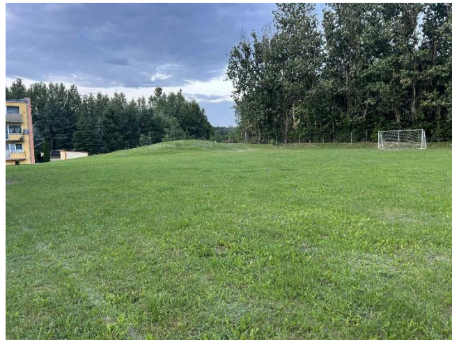
Miejsce do zagospodarowania