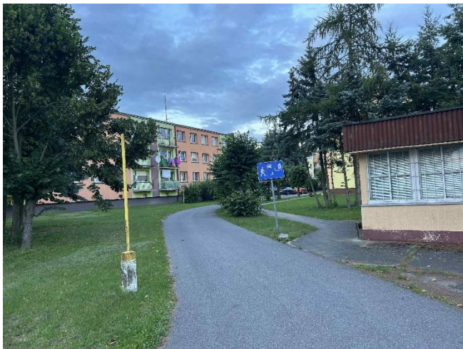
Droga dojazdowa do miejscowości