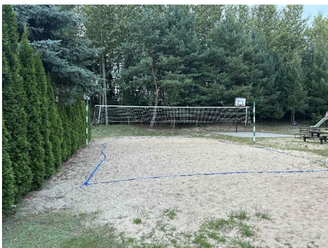
Boisko do piłki siatkowej